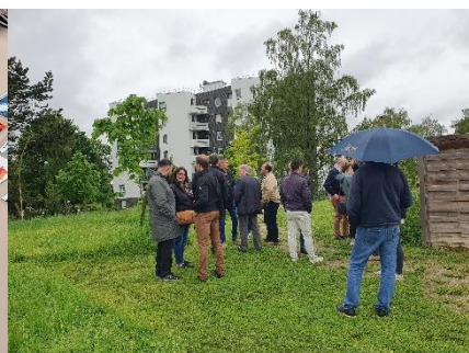
Rencontre Espaces verts

Canopée fonctionne comme un cabinet de conseil interne, aux côtés des bailleurs membres. Le réseau s'appuie sur l'animation de groupes de travail métiers orientés sur le cœur de métier des bailleurs (Construction, Enjeux énergétiques, Commercialisation, Gestion des impayés, Tranquillité, Nettoyage, Gestion des espaces verts...) et les fonctions support (Communication, Numérique, Financiers, Ressources Humaines, Contrôle de gestion...).