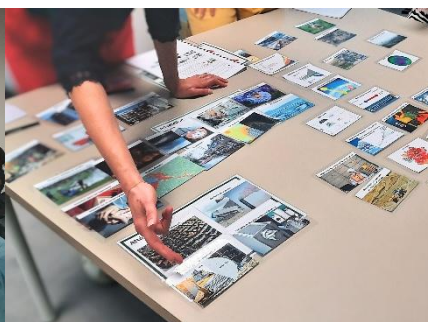
Fresque de l'Habitat Responsable