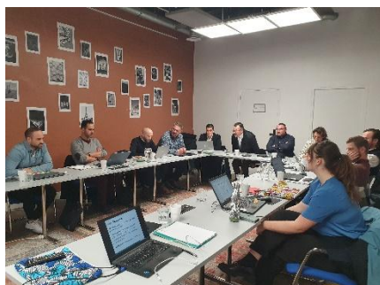
Séminaire Energies renouvelables